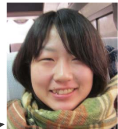
人間社会学域人文学類3年

能登を活性化しようと、エネルギッシュに常に新しいことに挑戦しようとしている地域の方たちと直接お話をし、とても良い刺激をもらいました。今後の道を考える上でも、自分にとって良い経験となりました。